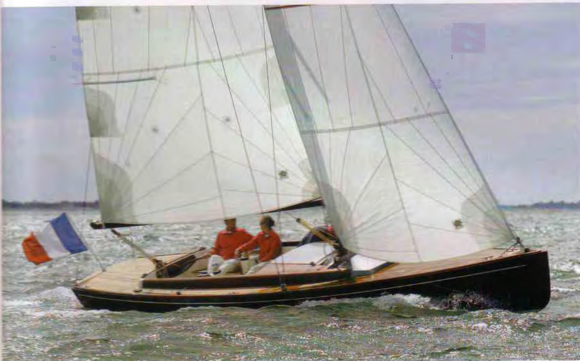
Le Tofinou 9,50 m sous voiles, un voilier très élégant et rapide. (photo Jean-Marie Liot).

Le chantier de Saint-Martin-de-Ré lance le Tofinou 9,50 m. Philippe Joubert, un fidèle de la plaisance classique.