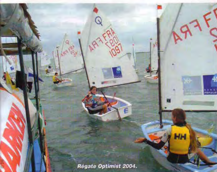
Régate Optimist 2004.