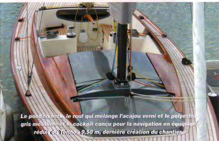
Le pont en teck, le rouf qui mélange l'acajou verni et le polyester gris métallisé et le cockpit conçu pour la navigation en équipage réduit du Tofinou 9,50 m, dernière création du chantier.