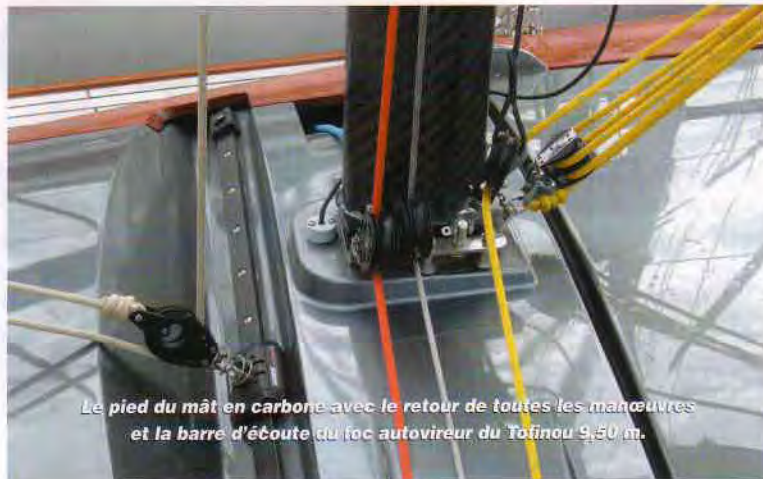
Le pied du mât en carbone avec le retour de toutes les manœuvres et la barre d'écoute du foc autovireur du Tofinou 9,50 m.